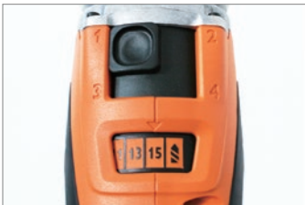
トルク設定 60段階： 4ギア×15ステップ