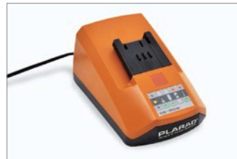
標準付属：100V 新型充電器付き フル充電時間 約40分