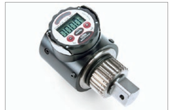
オプション：STトルクメーター 3機種 測定範囲：110～5500Nm 1Nm単位で締付トルクを高精度測定。