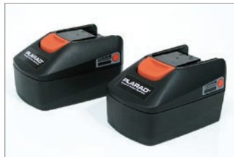
標準付属：大容量リチウムイオン バッテリー 2個付き