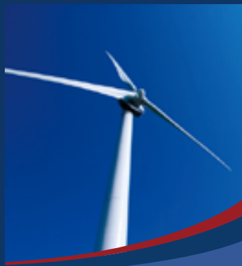
風力発電建設・メンテナンス