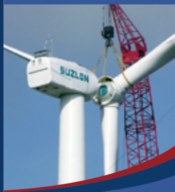
Suzlon Energy 社の風力発電