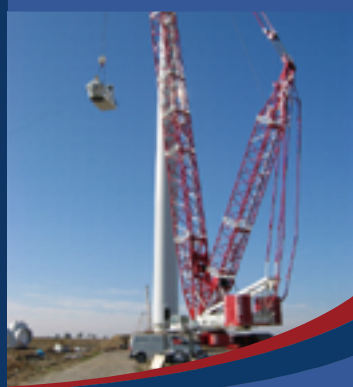
風力発電建設・メンテナンス